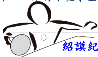
紹謨紀念體育館桌球室 111 學年度第 1 學期使用時間一覽表