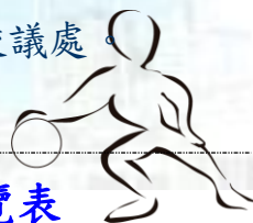
紹謨紀念體育館多功能球場 111 學年度第 1 學期使用時間一覽表