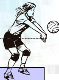
紹謨紀念體育館排球場 111 學年度第 1 學期使用時間一覽表